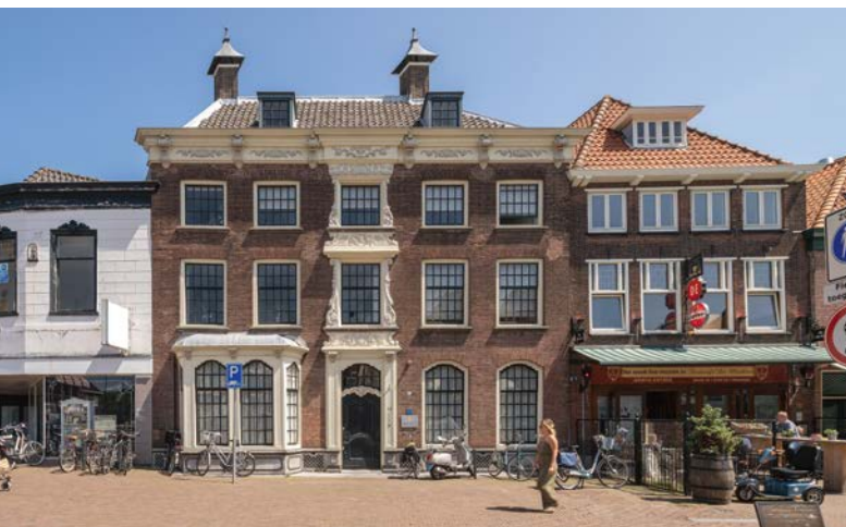
Gevel met erker, Markt 18, in Maassluis. L. Buthker 2018

Een architect die de vrije hand kreeg bij een villa-ontwerp integreerde naast een erker vaak ook een serre, een balkon en een veranda. Allemaal geliefde elementen die je in verschillende combinaties en uitvoeringen tegenkomt.